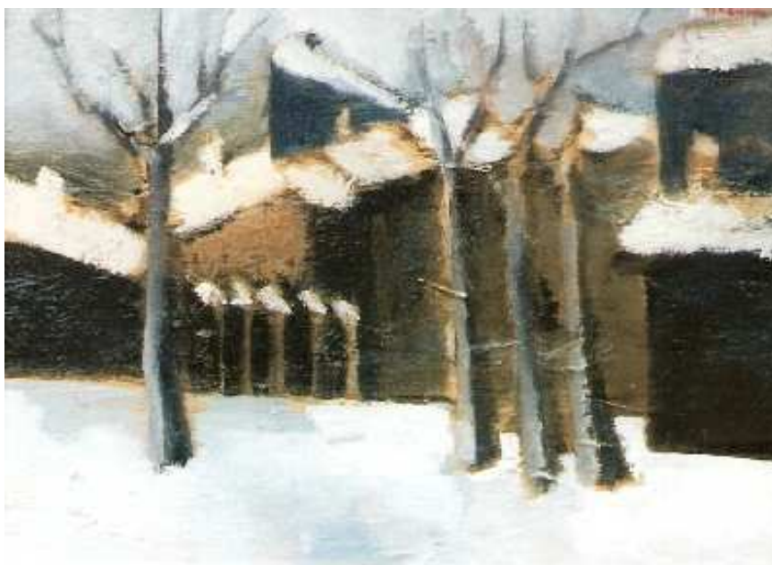
Mircea Ciobanu – „Peisaj sub zăpadă”

Când eu și Mircea am părăsit petrecerea, ninsoarea timidă care ne însoțise la venire se transformase într-o perdea deasă de fulgi, așternându-se pe asfaltul înghețat. Aproape că înotam pe covorul gros de zăpadă. Nu am găsit niciun taxi în noaptea aceea bucureșteană, în care doar fulgii erau atotputernici. Ne-am întors acasă pe jos, într-o tăcere desăvârșită.